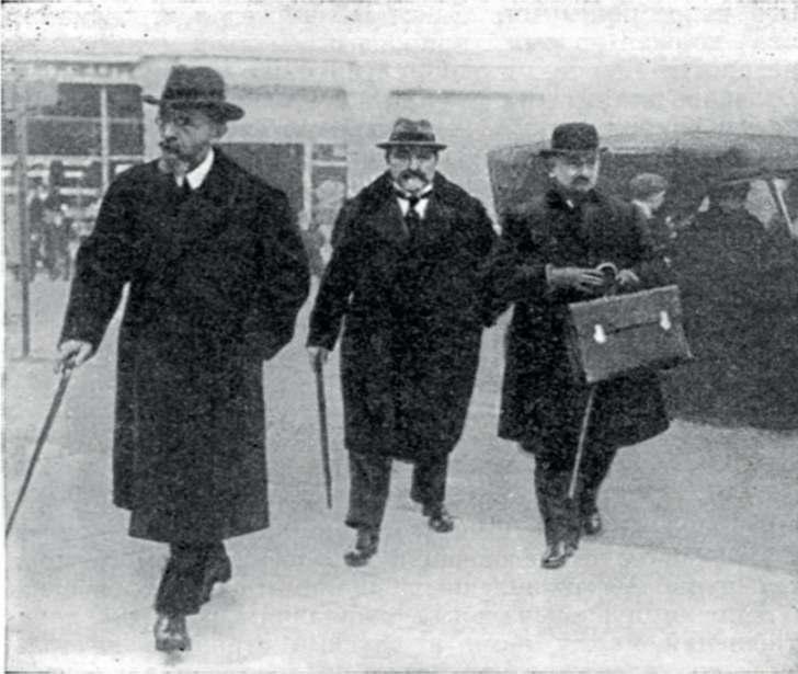
В. В. Боровский, Я. Х. Давтян и Г. В. Чичерин в Лозанне —1922 г.