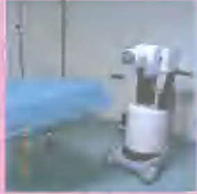
Resim 1: HDR brakiterapi cihazı

Bu tedavi tümörün çevresindeki sağlıklı doku ve yakın organlara daha az doz vererek olası yan etkileri azaltır.