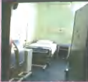
Resim 2: Brakiterapi odası