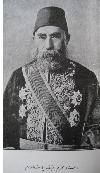
Üstad-ı muhterem Münif Paşa merhum.