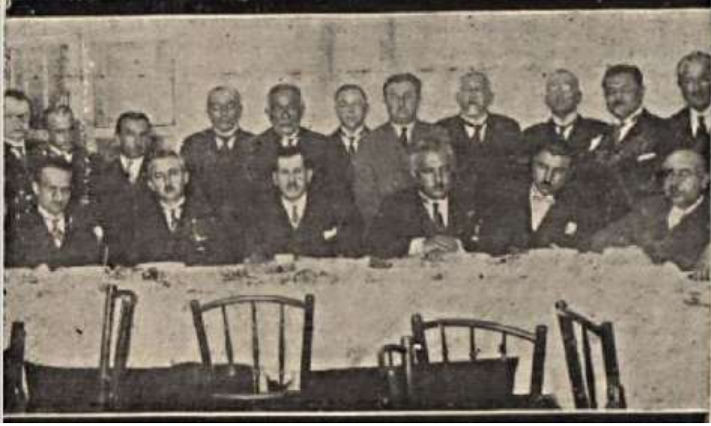
“Hukuk Mektebi’nin birinci yıldönümü hatırası (5 Teşrînisâni 1926, Cuma), vekiller profesörlerle beraber çay masasında”.