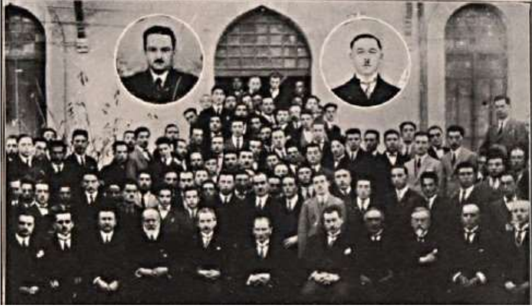
“Tedris Heyeti fahrî reisi büyük reisicumhurumuz Gazi Mustafa Kemal Paşa hazretleri resm-i küşâd günü profesörler ve talebe arasında”.