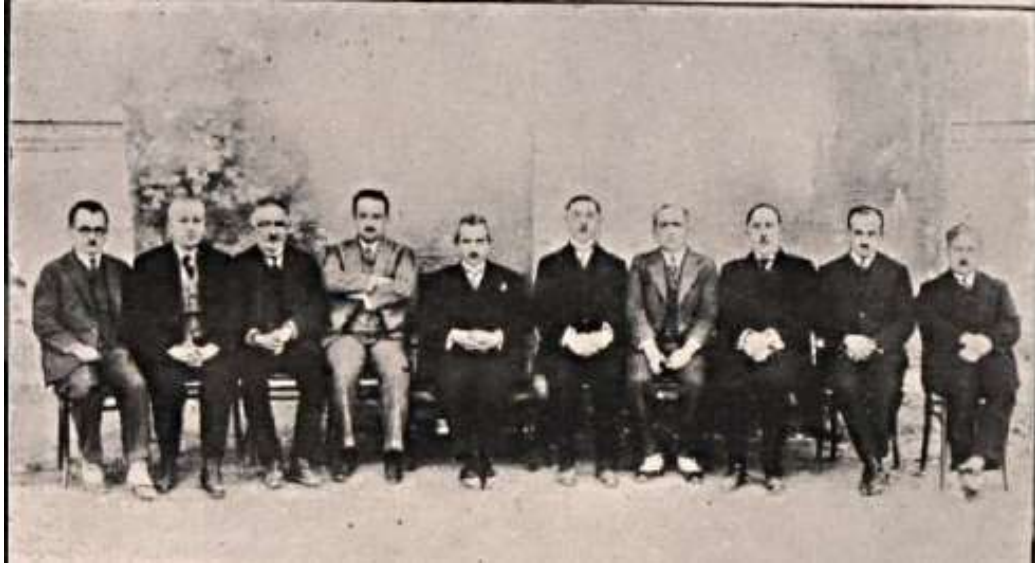
“Türk Hukuk Tarihi fahrî profesörü başvekil muhterem İsmet Paşa hazretleri ile bu sene bilfiil tedrisâтта bulunan profesörler”.