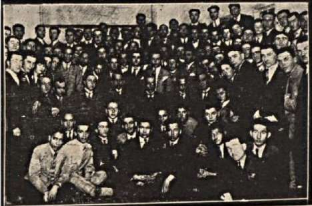
“Hukuk Mektebi’nin birinci yıldönümü hatırası (5 Teşrînisâni 1926, Cuma), profesörler ile talebeden bir kısmı bir arada”.