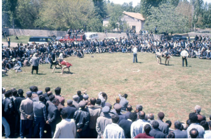
Fotoğraf 1: Geçmişte Kavaklık’ta yapılan Aba Güreşi’nden bir görüntü.

Günümüzün modern dünyasında modern sporlar gittikçe baskın hale gelmeye devam etmektedir. Modern sporların baskınlığı özellikle günümüzde Gaziantep ve Hatay’da baskın karakterde olan aba güreşini de olumsuz etkilemiştir. 1950-1980 arasında her sene kurban bayramının ikinci gününde yapılan aba güreşi (Şahin, 1999), günümüzde Gaziantep’te yılın belirli günlerinde organize edilen festivallerde yapılan bir etkinlik olma durumuna gelmiştir. Bu durum, sporun değişen yönünü vurgularken, geleneksel sporların günümüzdeki dezavantajlı durumunu açıkça ortaya koymaktadır.