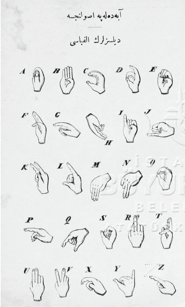
Resim 1: Abbé de Charles Michael de l'Épée Dilsiz Alfabeti