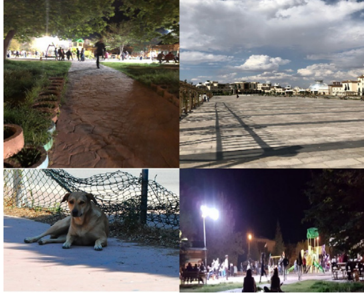
Görsel 1: Üniversite Çevresi Korku Mekanları

Bir yeri korku ile özdeşleştirmeyi etkileyen en önemli unsurlardan birisi de cinsiyettir. Yapılan mülakatlarda kız öğrenciler bir yeri daha çok korku ile anmaktadır. Aşağıdaki örnekler bu korkuyu da etkileyen birçok sebebi göz önüne sermektedir: