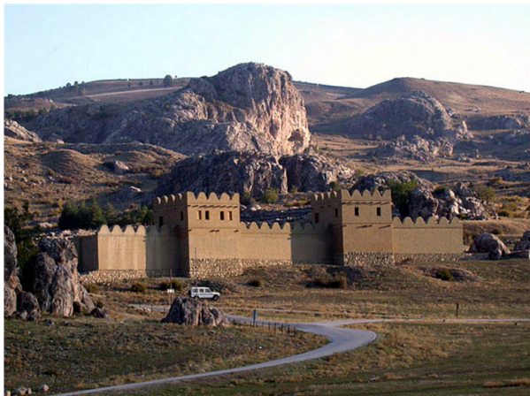
Figure 2: Hattuša : reconstitution d'une partie de la muraille (photo personnelle).

C'est donc bien l'apparition de l'écriture, couplée avec l'instauration d'une langue officielle qui fait de cet établissement urbain qu'est Hattuša le lieu du politique : le pouvoir peut se dire, s'écrire, se penser, se transmettre.