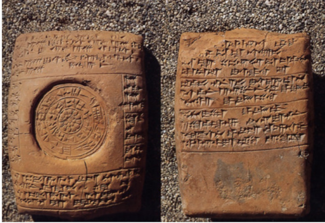
Figure 1: Tablette de donation de terre (écriture cunéiforme) (Neve, 1993, p. 61)

Cette écriture cunéiforme sera utilisée jusqu'au déclin de l'empire (vers 1190 A. C.) et disparaîtra avec lui. Ce sont donc les circonstances politiques, à savoir la centralisation du pouvoir à Hattuša, qui ont permis son apparition, ce sont d'autres circonstances politiques qui font qu'elle a disparu dans la tourmente qui a emporté l'empire hittite. Cette écriture était intrinsèquement liée au pouvoir central, à l'administration centrale. Lorsque les palais et centres du pouvoir qui étaient les lieux de leur utilisation ont disparu, langue et écriture ont disparu aussi.