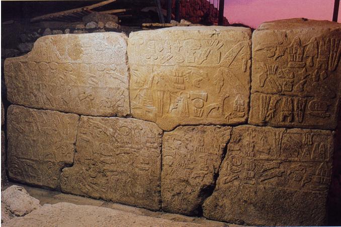
Figure 5: Inscription dite du Südburg (Ḫattuša), découverte en 1988 (Hawkins, 1995)

C'est dans ce contexte de bouleversement politique et culturel, et dans ce nouvel environnement mixte (hittite/hourrite/louvite) qu'il faut situer l'innovation que représentent les hiéroglyphes. Donc, parallèlement à cette écriture d'emprunt que sont les cunéiformes, les Hittites ont inventé et utilisé une autre écriture, hiéroglyphique. Cette écriture est l'aboutissement d'un long processus, dont on peut maintenant reconstituer les étapes (Mora, 1994).