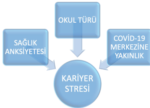
řekil 1. Arařtırmanın Modeli

Choi ve arkadařları tarafından 2011 yılında geliřtirilen kariyer stresi leđinin Trke uyarlaması zden ve arkadařları tarafından yapılmıř olup kariyer belirsizliđi boyutu test-tekrar-test gvenilirlik katsayısı 0.89 olarak bildirilmiřtir (10). Bu çalıřmada leđin 3 boyutu arasından "Kariyer Belirsizliđi ve Bilgi Eksikliđi" boyutu deđerlendirilmiřtir.