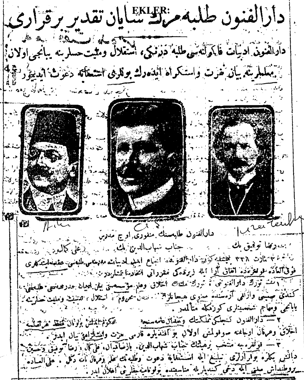
EK 1: Tevhid-i Efkar, 31 Mart 1922, s.1, "Darülfünun Talebimizin Şayan-ı Takdir Bir Kararı"